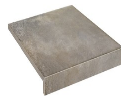
ALAVA JET NOCE33 33 60X60