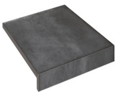
ALAVA JET ANTRACITA33 33 60X60