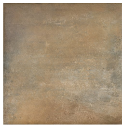
ALAVA FUEGO33 33 60X60