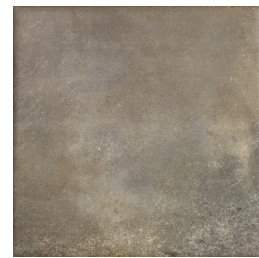
ALAVA NOCE33 33 60X60