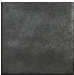
ALAVA ANTRACITA33 33 60X60