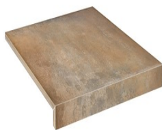
ALAVA JET FUEGO33 33 60X60