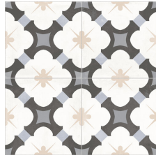
ALDANA MIDNIGHT 58X58 - 22,8"X22,8"