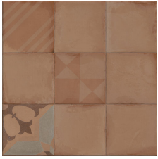
AXIS TERRA 58X58 - 22,8"X22,8"