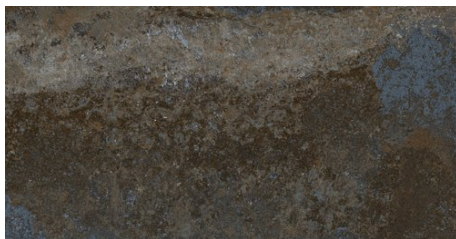
BENGALA GRIS 62X120 - 24,4"x47,2"