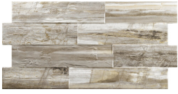
BRITISH BEIGE 33,2X66,5 - 13,1"X26,2"