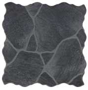
CALA ANTRACITA 45X45 - 17,7"X17,7"