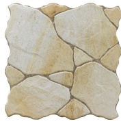
CALA BEIGE 45X45 - 17,7"X17,7"