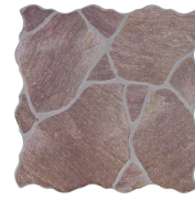
CALA RODENO 45X45 - 17,7"X17,7"