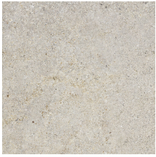
CANDELA GRIS 58X58 - 22,8"x22,8"