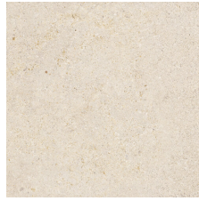
CANDELA ARENA 58X58 - 22,8"x22,8"