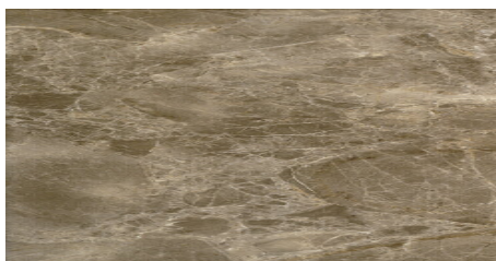
CLASIC AB MARRON 62X120 - 24,4"X47,2"