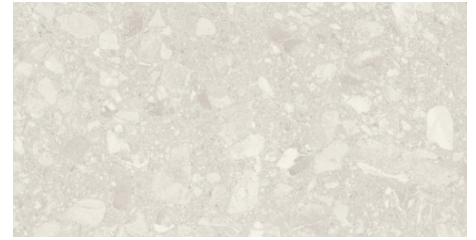
DAKOTA BONE 62X120 - 24,4"x47,2"