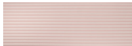
DEVON ROSA 40X120 - 15,7"X47,2"