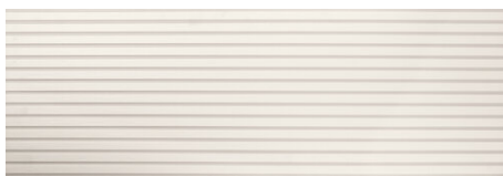
DEVON BLANCO 40X120 - 15,7"X47,2"