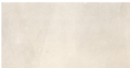
EDISON MARFIL 62X120 - 24,4"X47,2"