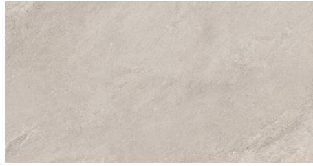
ELEMENT SAND 62X120 - 24,4"x47,2"