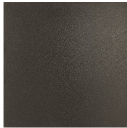
LAVANDA GRIS33 33 44,5X44,5