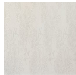
LAVANDA BLANCO33 33 30X90