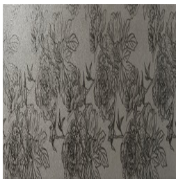
LAVANDA GRIS33 33 30X90