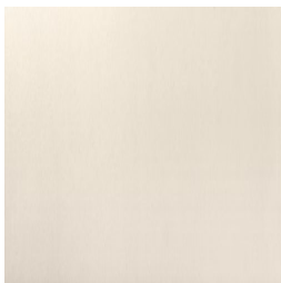
LAVANDA BASE BLANCO33 33 30X90