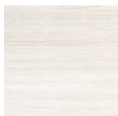
LAYERS BONE 44,5X44,5 - 17,5"X17,5"