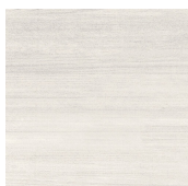
LAYERS GRIS 44,5X44,5 - 17,5"X17,5"