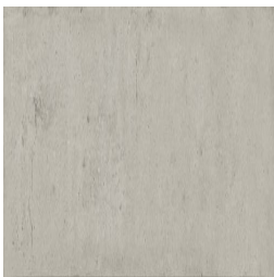
NERVI GRIS33 33 30X90