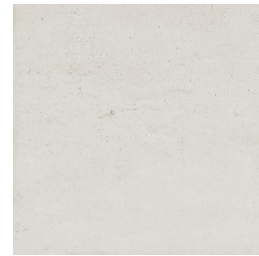
NERVI PERLA33 33 60X60