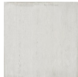
NERVI PERLA33 33 30X90