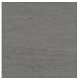
NERVI MARENGO33 33 30X90