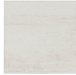
NERVI PERLA33 33 62X120