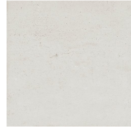
NERVI PERLA33 33 59X59