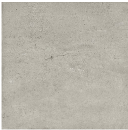
NERVI GRIS33 33 60X60