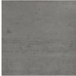
NERVI MARENGO33 33 59X59