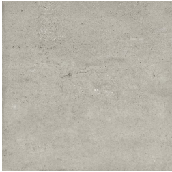
NERVI GRIS33 33 59X59