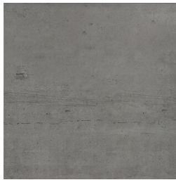
NERVI MARENGO33 33 60X60