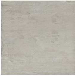
NERVI GRIS33 33 62X120