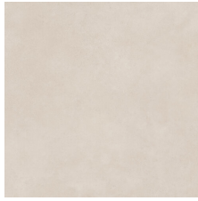
PALMETO BONE 58X58 - 22,8"X22,8"