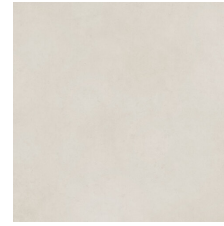
PALMETO PERLA 58X58 - 22,8"X22,8"