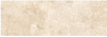
SARDINIA BASE ALMOND 40X120 - 15,7"X47,2"