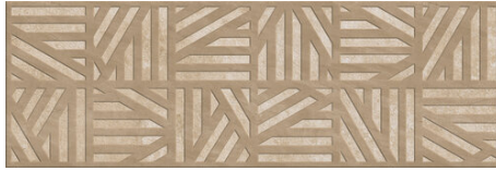
SARDINIA ALMOND 40X120 - 15,7"X47,2"