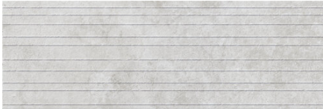
SARDINIA STUCCO GREY 40X120 - 15,7"X47,2"