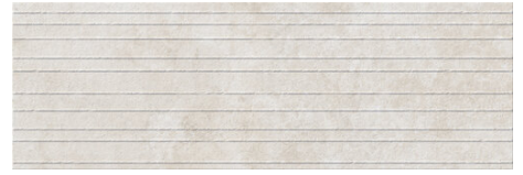
SARDINIA STUCCO ALMOND 40X120 - 15,7"X47,2"