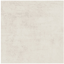
STUDIO BONE 58X58 - 22,8"x22,8"