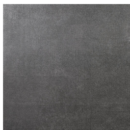
TRANSIT ANTRACITA33 33 60X60