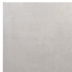
TRANSIT BONE33 33 60X60