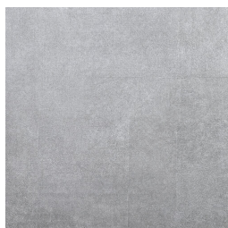
TRANSIT GRIS33 33 60X60