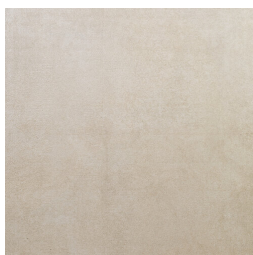
TRANSIT BEIGE33 33 60X60