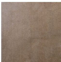
TRANSIT MARRÓN33 33 60X60