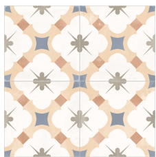
ALDANA CARMEL 58X58 - 22,8"X22,8"