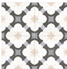
ALDANA MIDNIGHT 58X58 - 22,8"X22,8"