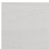
ALGARVE GRIS 44,5X44,5 - 17,5"X17,5"