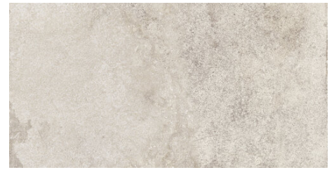
ALHAMA GREY 62X120 - 24,4"X47,2"