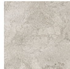
ALHAMA GREY 58X58 - 22,8"X22,8"