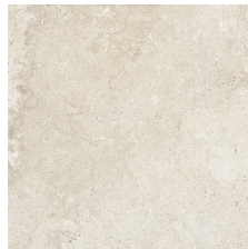
ALHAMA BONE 58X58 - 22,8"X22,8"