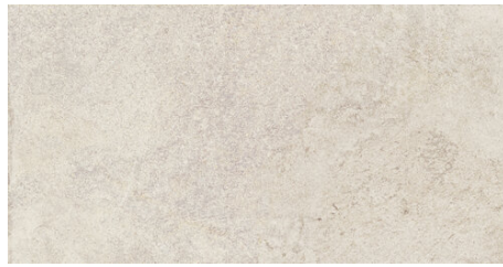
ALHAMA BONE 62X120 - 24,4"X47,2"