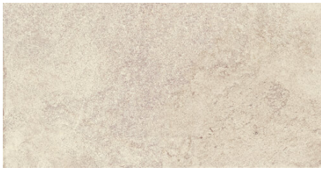
ALHAMA BEIGE 62X120 - 24,4"X47,2"