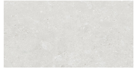
AMALFI SILVER 62X120 - 24,4"X47,2"