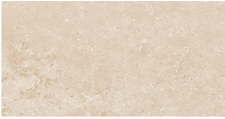
AMALFI BEIGE 62X120 - 24,4"X47,2"