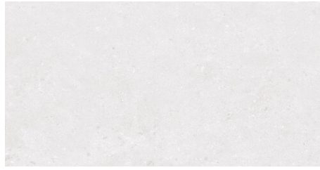
AMALFI WHITE 62X120 - 24,4"X47,2"