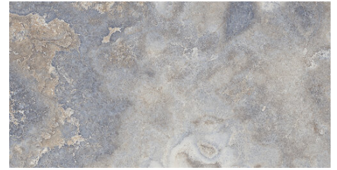
AMERICA CELESTE 62X120 - 24,4\"X47,2"