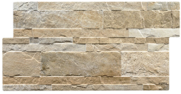
ANDES BEIGE 33,2X66,5 - 13,1"X26,2"