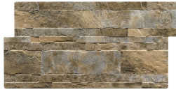
ANDES FUEGO 33,2X66,5 - 13,1"X26,2"