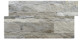
ANDES GRIS 33,2X66,5 - 13,1"X26,2"