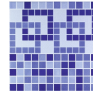
AQUA DECOR AZUL 33,3X33,3 - 13,1"X13,1"