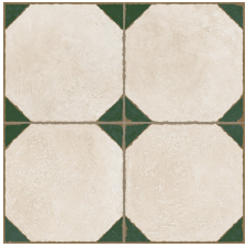
ARTISTIC GREEN 58X58 - 22,8"X22,8"