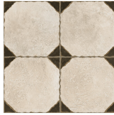
ARTISTIC BLACK 58X58 - 22,8"X22,8"