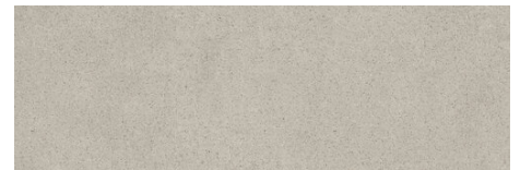
BATH BASE GREY 40X120 - 15,7"X47,2"