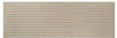
BATH GREY 40X120 - 15,7"X47,2"