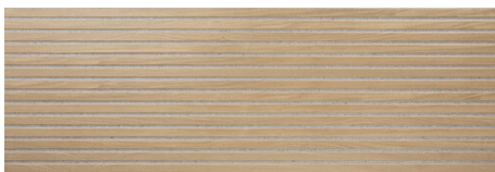
BATH BEIGE 40X120 - 15,7"X47,2"