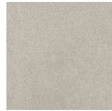
BATH GREY 58X58 - 22,8"X22,8"