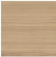
BATH BEIGE 58X58 - 22,8"X22,8"