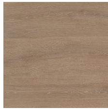
BATH BROWN 58X58 - 22,8"X22,8"