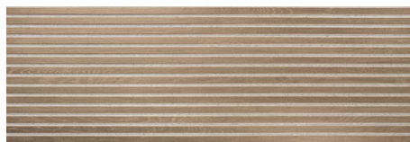
BATH BROWN 40X120 - 15,7"X47,2"