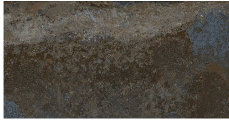
BENGALA GRIS 62X120 - 24,4"X47,2"