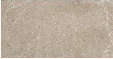
CARDIGAN BEIGE 62X120 - 24,4"X47,2"