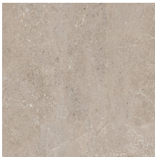
CARDIGAN BEIGE 58X58 - 22,8"X22,8"