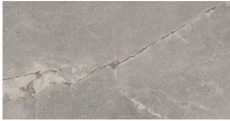
CARDIGAN GRIS 62X120 - 24,4"X47,2"