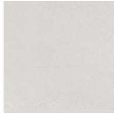
COLMAR GREY 58X58 - 22,8"x22,8"