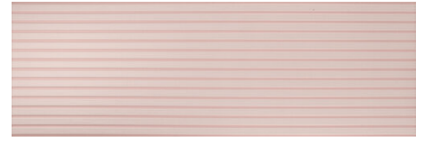
DEVON ROSA 40X120 - 15,7"X47,2"