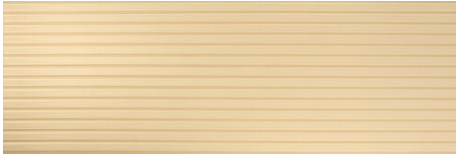
DEVON OCRE 40X120 - 15,7"X47,2"