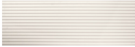
DEVON BLANCO 40X120 - 15,7"X47,2"