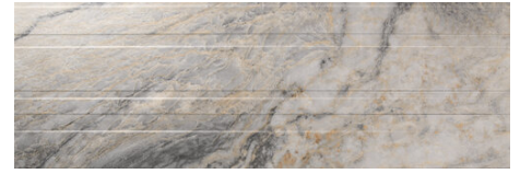
DUBAI STRIPES GREY 40X120 - 15,7"X47,2"