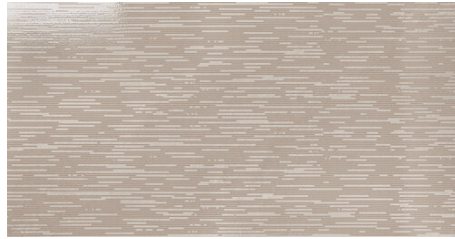
ELEMENT DECOR SAND 62X120 - 24,4"X47,2"