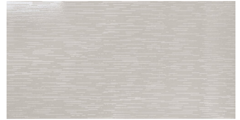
ELEMENT DECOR PEARL 62X120 - 24,4"X47,2"