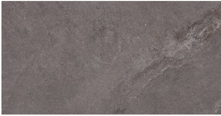
ELEMENT ANTRACITA 62X120 - 24,4"X47,2"