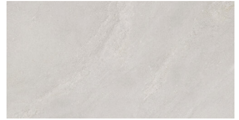
ELEMENT PEARL 62X120 - 24,4"X47,2"