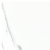
EXCELSIOR BLANCO 44,5X44,5 - 17,5"X17,5"