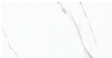
EXCELSIOR AB BLANCO 62X120 - 24,4"X47,2"