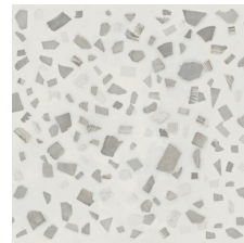
FLORA BLANCO 58X58 - 22,8"X22,8"