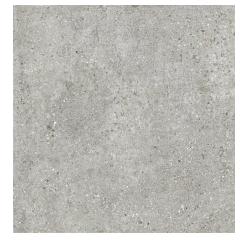
HAMBURG PERLA 60X60 - 23,6"X23,6"