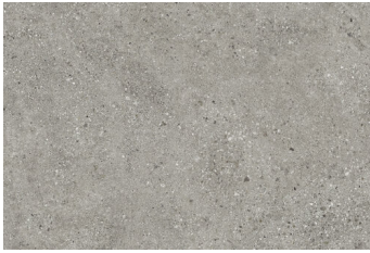
HAMBURG GRIS 60X90 - 23,6"X35,4"