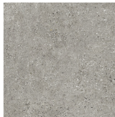
HAMBURG GRIS 60X60 - 23,6"X23,6"