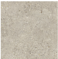
HAMBURG BEIGE 60X60 - 23,6"X23,6"