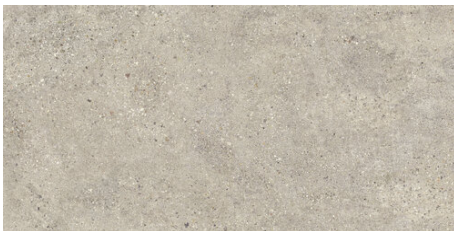
HAMBURG BEIGE 60X120 - 23,6"X47,2"