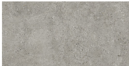
HAMBURG GRIS 60X120 - 23,6"X47,2"