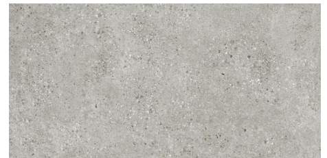
HAMBURG PERLA 60X120 - 23,6"X47,2"