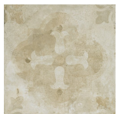
KANO DECOR BEIGE 60X60 - 23,6"x23,6"