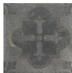
KANO DECOR ANTRACITA 60X60 - 23,6"x23,6"