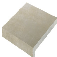
KANO BEIGE 60X60 - 23,6"x23,6"