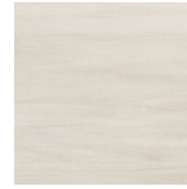
MALLORCA PERLA 44,5X44,5 - 17,5"X17,5"