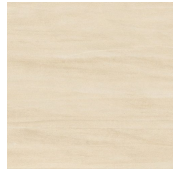
MALLORCA BONE 44,5X44,5 - 17,5"X17,5"