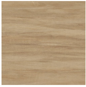
MALLORCA BEIGE 44,5X44,5 - 17,5"X17,5"