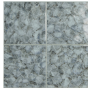
NAXOS TURQUESA 33,3X33,3 - 13,1"X13,1"