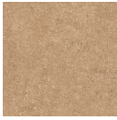
OTEROS CUERO 33,3X33,3 - 13,1"X13,1"