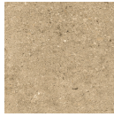
OTEROS BEIGE 33,3X33,3 - 13,1"X13,1"