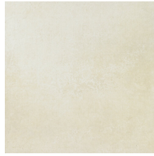
PACIFIC BONE 58X58 - 22,8"X22,8"