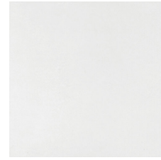
PACIFIC PERLA 58X58 - 22,8"X22,8"