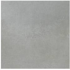
PACIFIC GRIS 58X58 - 22,8"X22,8"