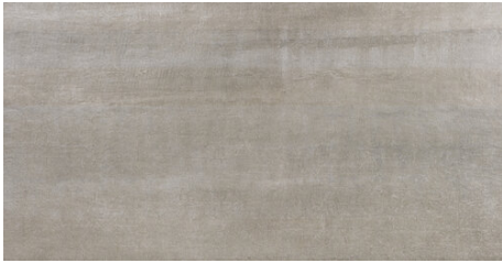
PORTLAND SAGE 62X120 - 24,4"x47,2"