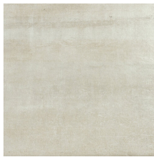
PORTLAND BONE 58X58 - 22,8"x22,8"