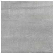
PORTLAND GRIS 58X58 - 22,8"x22,8"