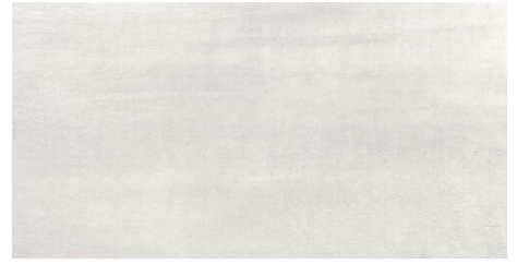
PORTLAND PERLA 62X120 - 24,4"x47,2"