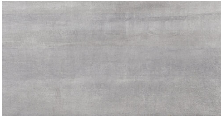
PORTLAND GRIS 62X120 - 24,4"x47,2"