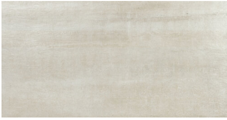
PORTLAND BONE 62X120 - 24,4"x47,2"