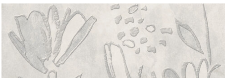
PRADA DECOR PERLA 40X120 - 15,7"x47,2"