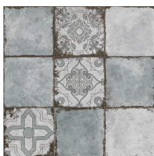
RIALTO DECOR CELESTE 58X58 - 22,8"x22,8"