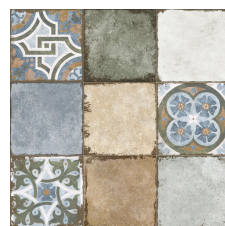
RIALTO DECOR MIX 58X58 - 22,8"x22,8"