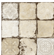
RIALTO DECOR BEIGE 58X58 - 22,8"x22,8"