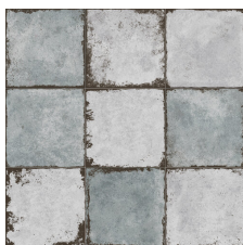
RIALTO CELESTE 58X58 - 22,8"x22,8"