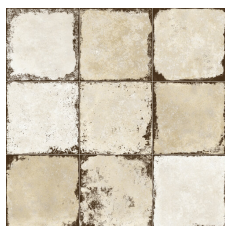
RIALTO BEIGE 58X58 - 22,8"x22,8"