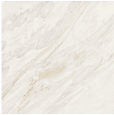
SAMOA WHITE 58X58 - 22,8"X22,8"