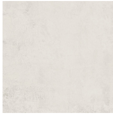
STUDIO PERLA 58X58 - 22,8"X22,8"