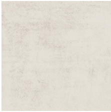
STUDIO BONE 58X58 - 22,8"X22,8"