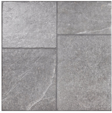
TERRANO GRIS 58X58 - 22,8"X22,8"