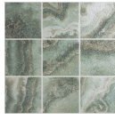
TULUM VERDE 33,3X33,3 - 13,1"X13,1"