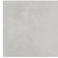
VOGUE ALMOND 58X58 - 22,8"X22,8"