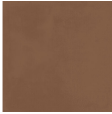
VOGUE MOKA 58X58 - 22,8"X22,8"